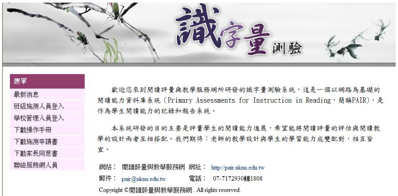
▲ 圖 1-2 PAIR 基礎閱讀教學評量網站的識字評量區