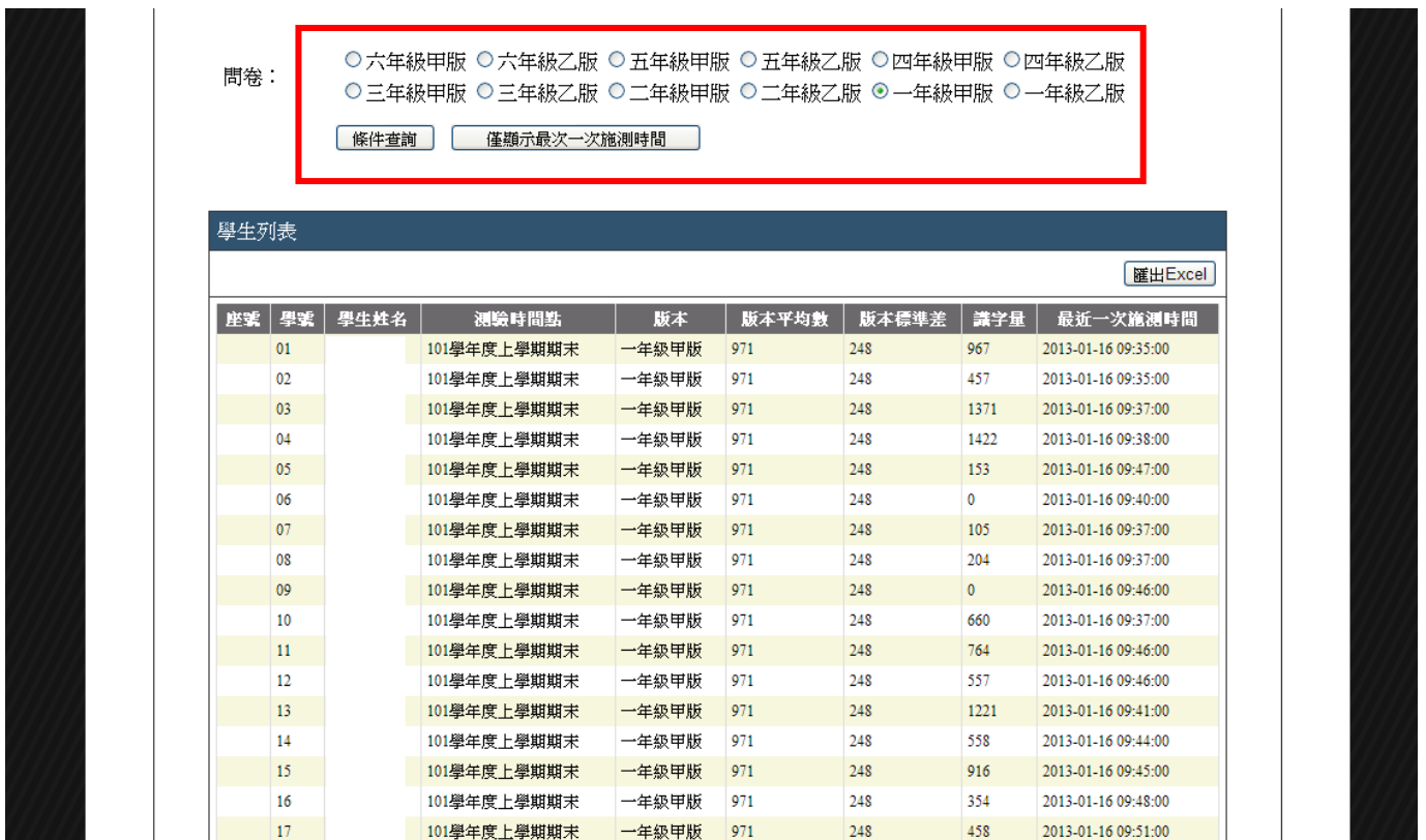
▲ 圖 3-2 學生識字量報告區