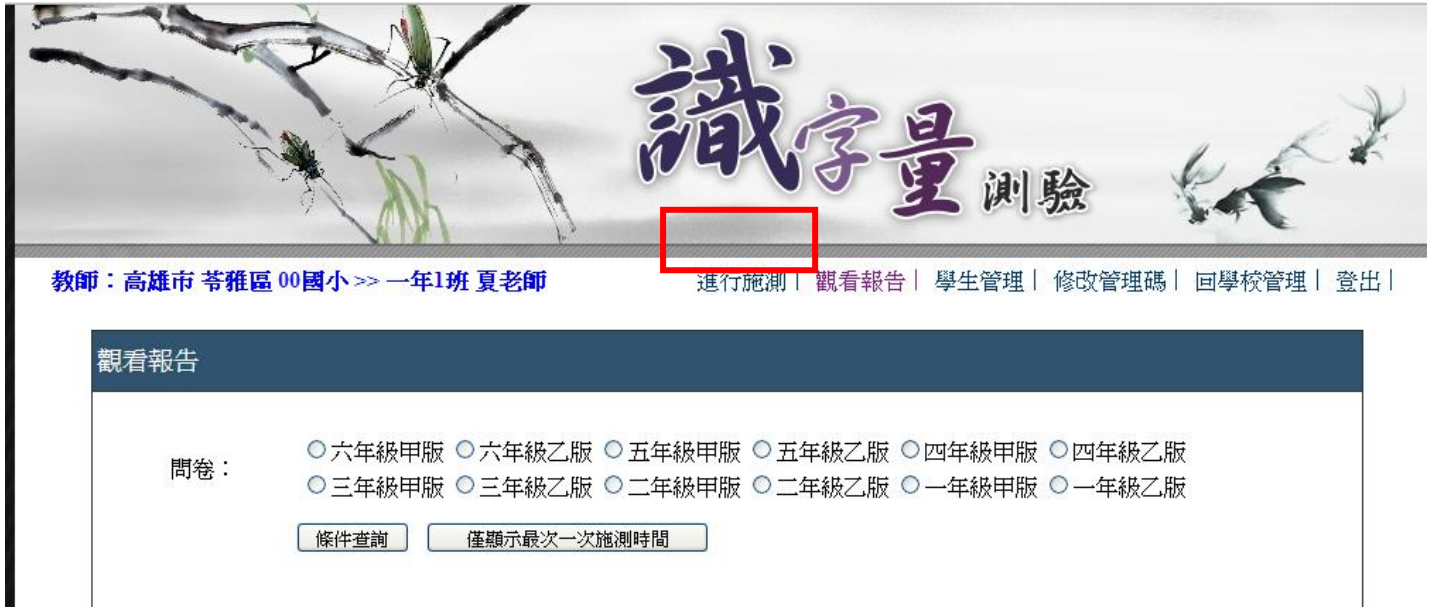
▲ 圖 3-1 進入學生識字量報告區