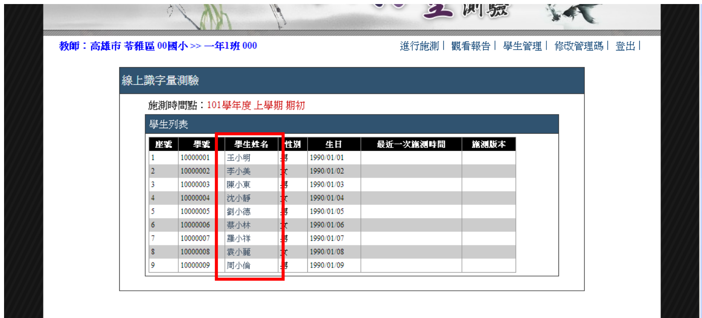
▲ 圖 2-3 線上識字測驗的學生列表