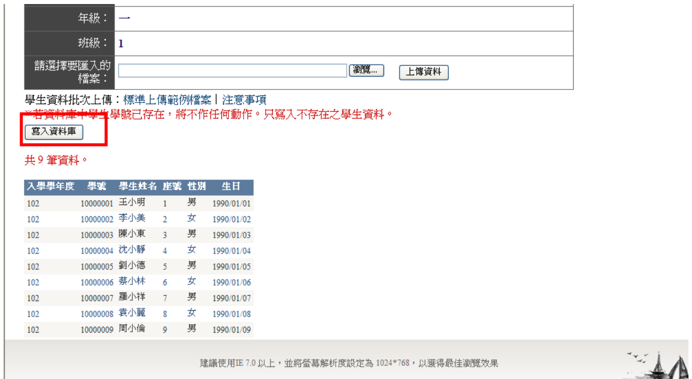
▲ 圖 4-5 匯入學生名單頁面