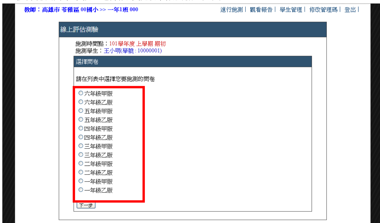
▲ 圖 2-4 選擇測驗版本