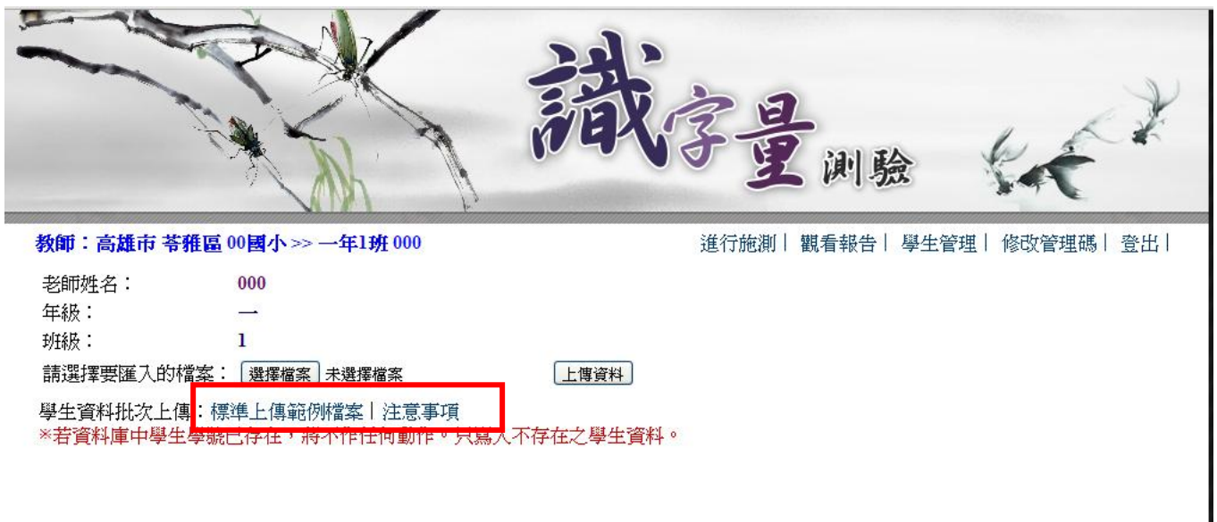
▲ 圖 4-4 檔案匯入範例下載及注意事項