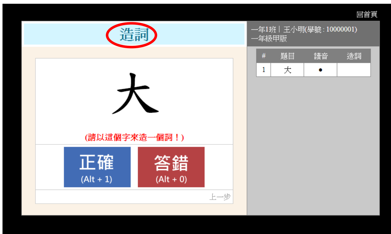
▲ 圖 2-7 造詞頁面

再根據小朋友的回答，填答「正確」或「答錯」，同樣也有鍵盤及滑鼠兩種操作方式。如圖 4-7。