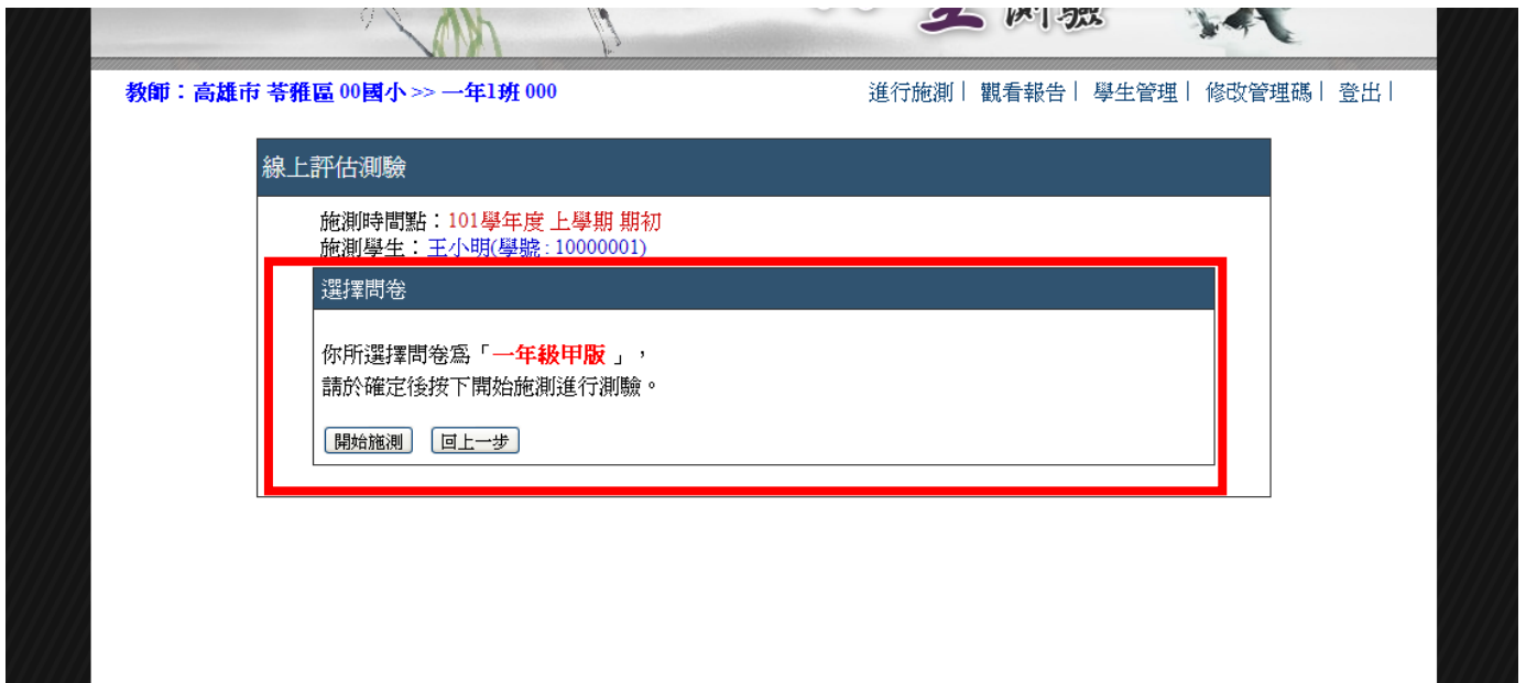
▲ 圖 2-5 確認選擇問卷無誤