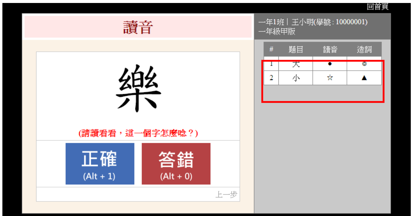
▲ 圖 2-8 正確或錯誤答案標記。

9. 答對會出現「•」或「◎」的標記，答錯則會出現「☆」或「▲」的標記。如圖 4-8。