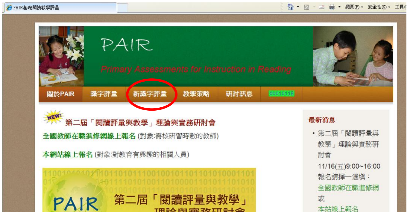
▲ 圖 1-1 PAIR 基礎閱讀教學評量網站的首頁