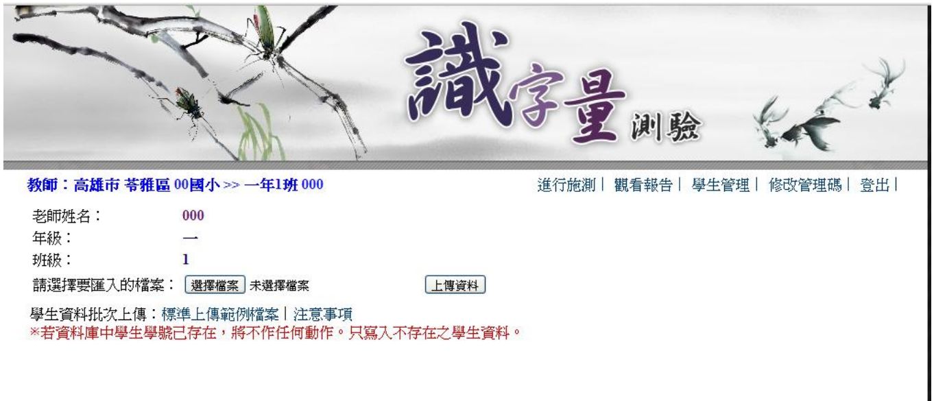
▲ 圖 4-3 檔案匯入學生名單頁面