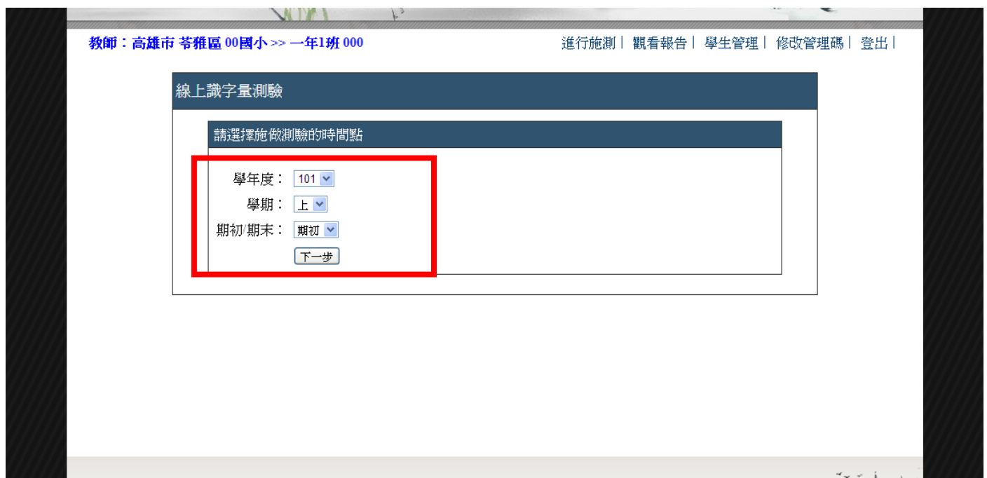
▲ 圖 2-2 輸入施測時間點之頁面