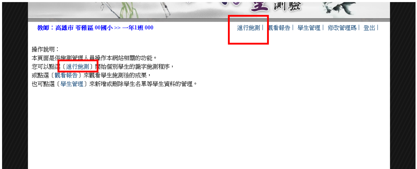
▲ 圖 2-1 輸入施測時間點之頁面